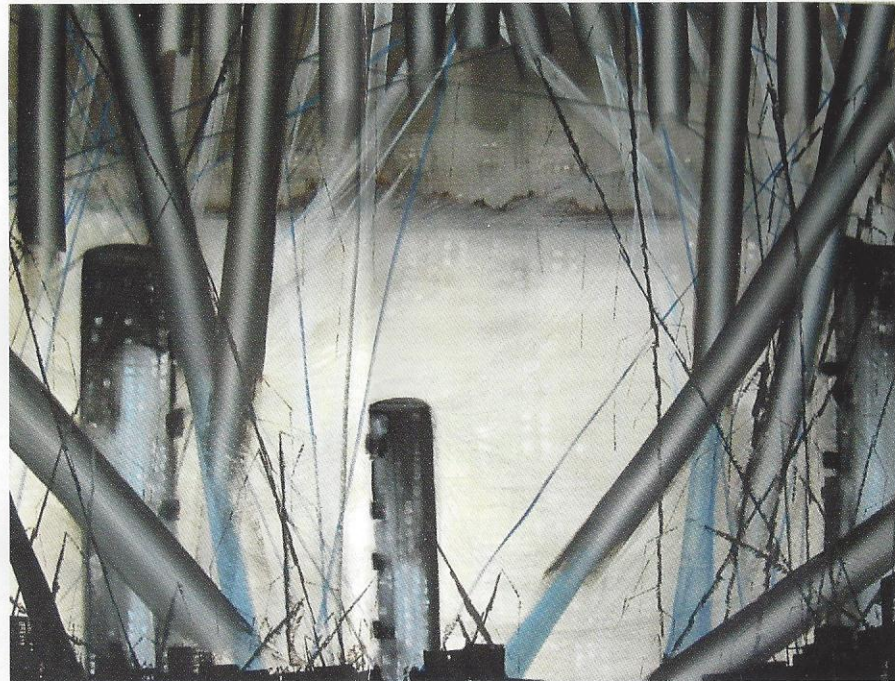
1.70m x 1.20m

tot -3,30), terwijl de hoeveelheid virus juist is toegenomen (1,030 kopieën/ml/jaar; 95%-BI: 0,998 tot 1,072). Dit komt – sinds de eerste beschrijving van aids in 1981 – neer op een gemiddelde afname van 147,90 CD4+-T-cellen per \mu l en een gemiddelde toename van 2,455 kopieën per ml viraal RNA tijdens vroege infectie. Deze resultaten suggereren niet alleen een stijgende progressie en verhoogd risico op overdracht, maar benadrukken tegelijkertijd de noodzaak van het tijdig starten met antiretrovirale therapie. De meeste onderzoeken bestuderen het hiv-1-virus subtype B, dat vooral voorkomt in Noord-Amerika en Europa. Daarom is volgens de onderzoekers verder onderzoek naar andere subtypen in andere populaties en locaties, vooral in zuidelijk Afrika, essentieel.